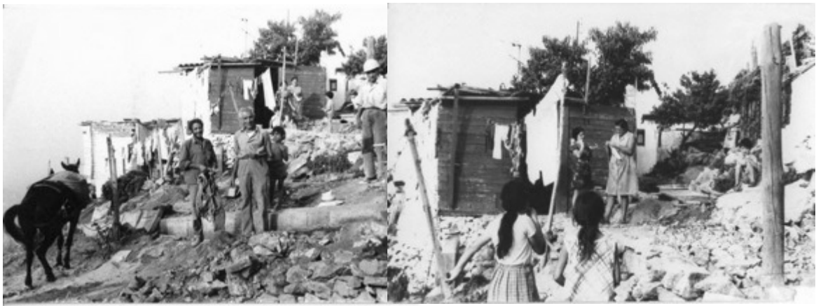
Barraques al nucli dels Canons del Carmel, anys 70.

Faltaven els serveis bàsics com la llum i l'aigua, i calia fer llargues caminades a les fonts. L'aïllament i la falta de transports també obligava els que treballaven a les fàbriques, en la construcció o en el servei domèstic a fer llargs trajectes a peu. Les criatures, en el millor dels casos, podien anar a l'escola en centres pròxims gestionats per l'Església.