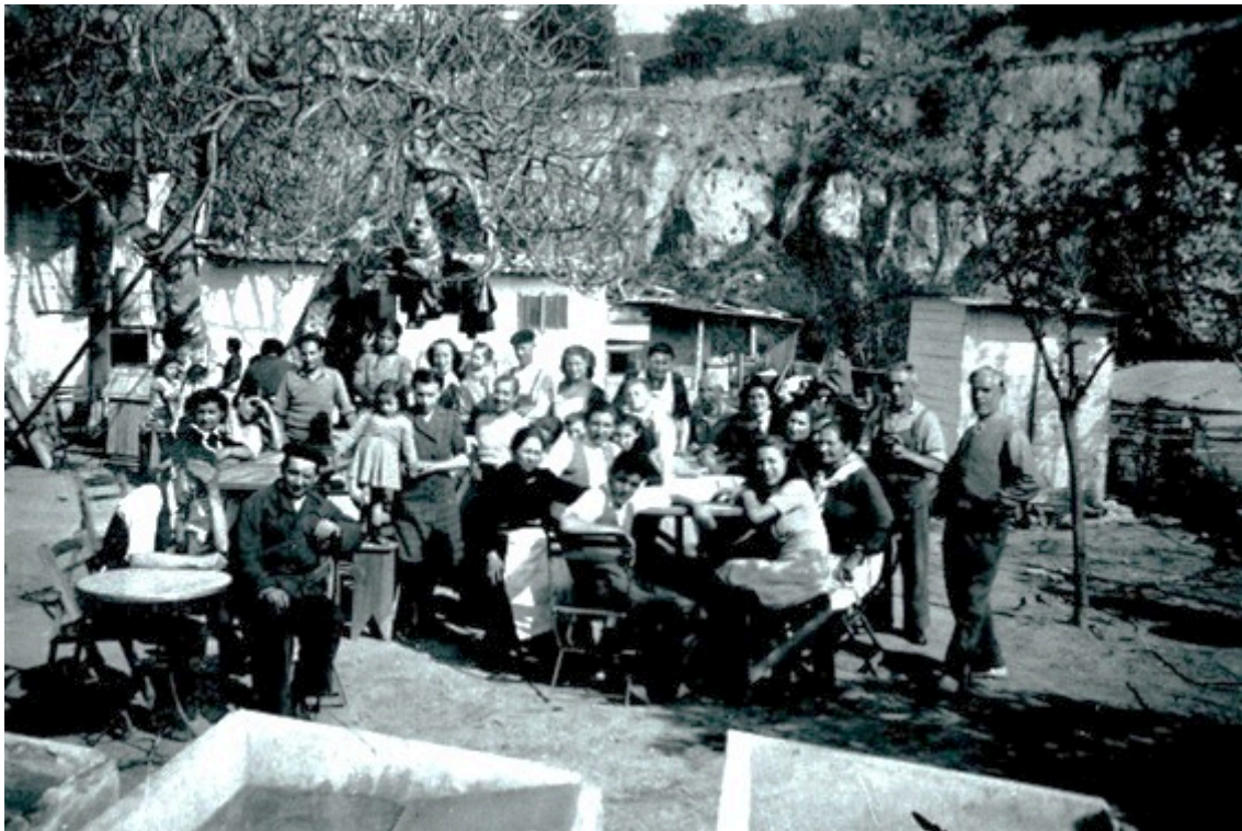
Can Valero, Montjuïc, 1945. Col. Flora Serrano

A finals dels anys cinquanta del segle XX, unes 100.000 persones, un 7 per cent de la població de Barcelona, vivien en barraques a causa d'una falta d'habitatge crònica. Els últims grans nuclis de barraques de Barcelona es van enderrocar poc abans dels Jocs Olímpics de 1992. La ciutat girava full a un episodi llarg i important de la seva història que havia durat més d'un segle.