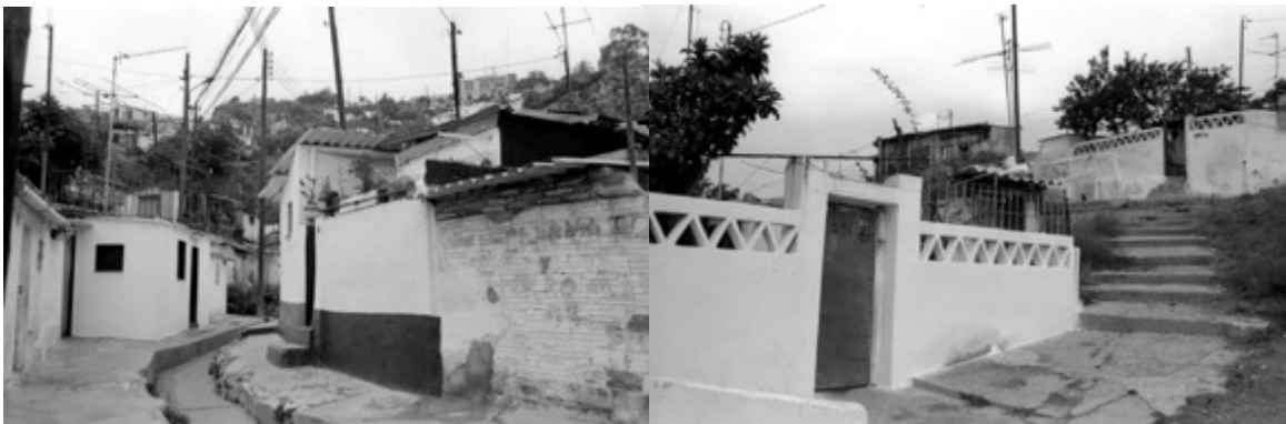
Barraques a Francesc Alegre, 1981. APMHB

La placa està situada dins l'espai patrimonial del turó de la Rovira que gestiona el Museu d'Història de Barcelona, format per la bateria antiaèria de la Guerra Civil i les restes de les barraques que hi van sorgir a partir de la postguerra, al final del carrer Marià Labèrnia. També s'hi ha instal·lat una torreta informativa, amb textos i imatges, sobre els barris de barraques del Carmel.