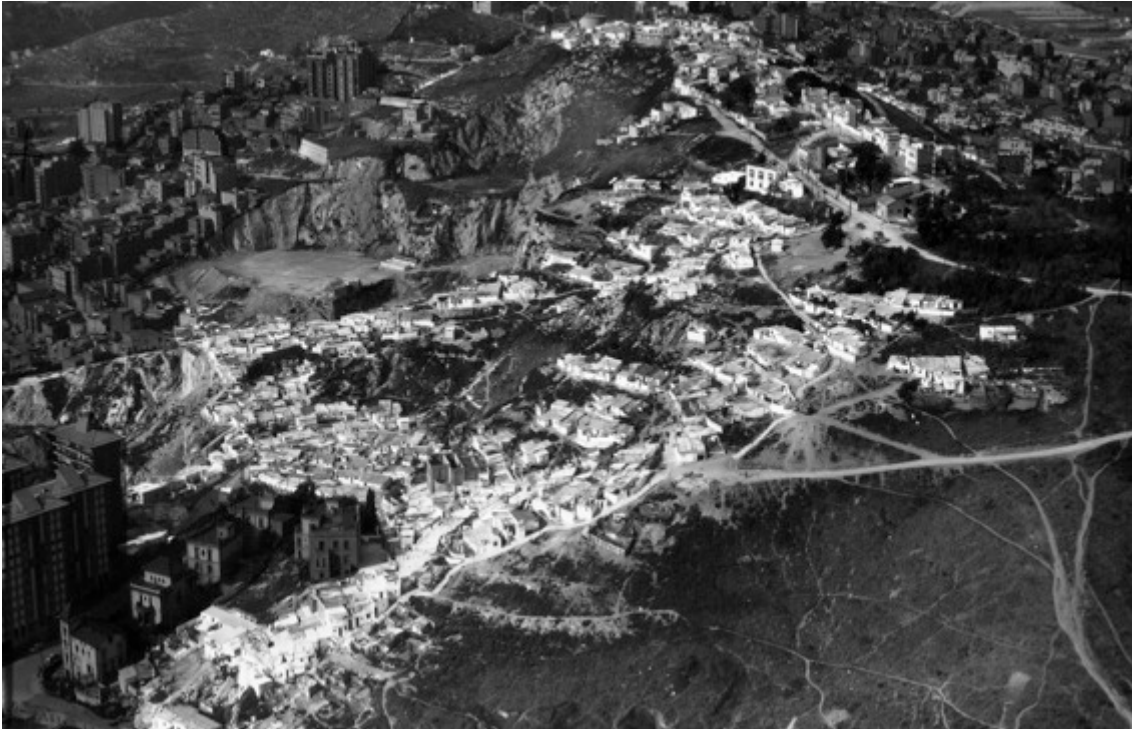
Barraques de Francesc Alegre i dels Canons, 1972.

Diumenge 26 de març, a les 11.15 hores, Barcelona ret homenatge a les persones que van viure als barris de barraques del Carmel i de Can Baró, amb una placa situada a l'espai patrimonial MUHBA del turó de la Rovira, al final del carrer Marià Labèrnia