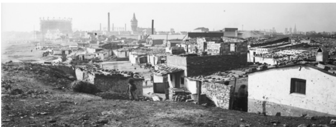
Barri del Somorrostro, c. 1950. Xavier Vallory March, Obra Social catequesi Sant Joan Bosco

Al llarg de l'any 2016 La Comissió ciutadana per a la recuperació de la memòria dels barris de barraques ha organitzat una exposició fotogràfica i diversos actes i debats amb motiu dels 50 anys de l'enderroc del barri del Somorrostro .