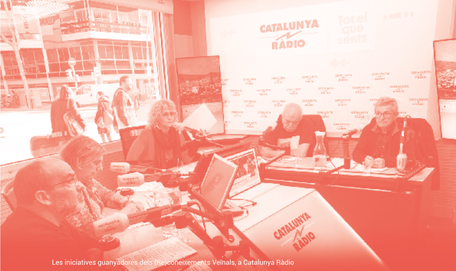
Les iniciatives guanyadores dels (Re)coneixements Veïnals, a Catalunya Ràdio